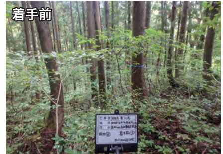
柏崎市 経営管理権集積計画 第1-1号(高柳地区)