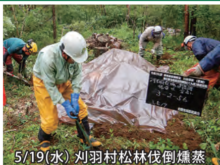
5/19(水) 刈羽村松林伐倒燻蒸