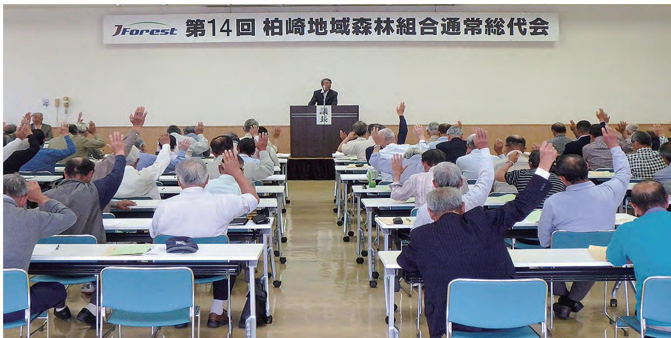
第14回 通常総代会の様子