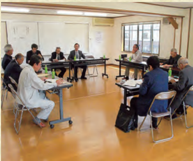
前回の役員候補者推薦会議

現役員の任期満了に伴う役員改選を、本年5月29日に開催予定の第13回通常総代会にて行います。役員改選は、4月に実施予定の役員推薦会議で選任された候補者を総代会出席の総代による投票で決定いたします。役員定数は以下のとおりであり、各区域の皆様のご理解をよろしく願います。