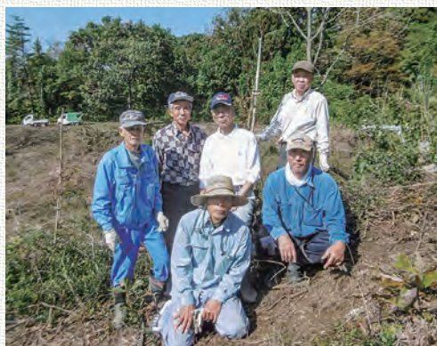
森づくりの仲間たち

まだまだわからない事が多く、油断が大きな事故に繋がる職業なので、先輩のご指導の下、しっかり技術を身に付け働きたいと思います。この先、失敗し迷惑をかける事もあると思いますが、ご指導のほどよろしくをお願いします。