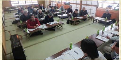
昨年度、上条コミセンでの座談会

森林組合の現状、事業内容の説明、 行政からの情報提供、質疑応答 ※概ね2時間を予定しております。