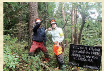
緑の雇用事業による新人教育

お問合せは 柏崎地域森林組合 ☎0257-22-6212 fax 0257-22-6234