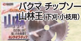
バクマ チップソー 山林王(下刈小枝用)

9インチ (230mm×36P) 標準価格2,835円を 1,950円 (税込) 10インチ (255mm×36P) 標準価格2,970円を 2,050円 (税込)