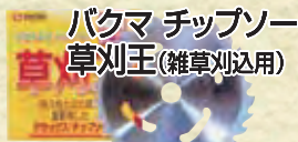
バクマ チップソー 草刈王(雑草刈込用)

9インチ (230mm×40P) 標準価格3,915円を 2,380円 (税込) 10インチ (255mm×40P) 標準価格4,104円を 2,480円 (税込)