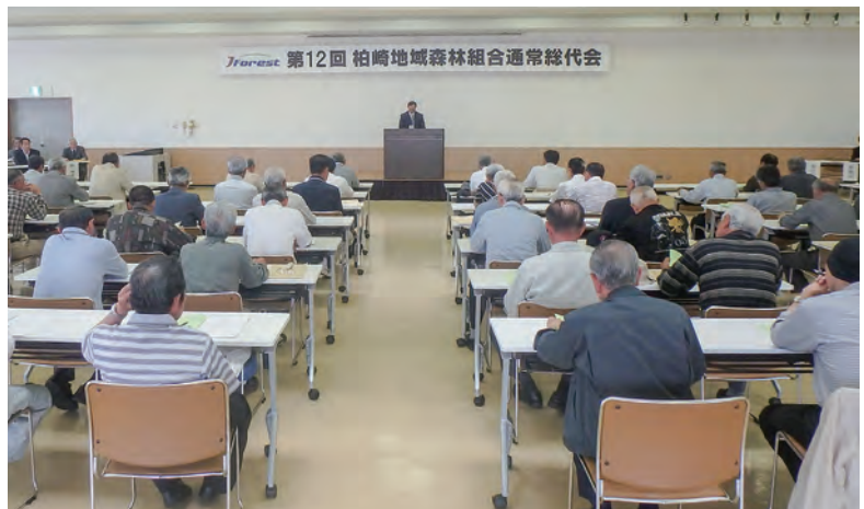
第12回 通常総代会の様子

組合運営に当たり、組合員をはじめ関係機関のご指導、ご支援に心から感謝を申し上げ事業報告といたします。