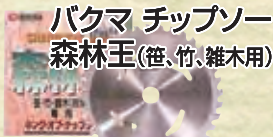
バクマ チップソー 森林王(笹、竹、雑木用)

9インチ (230mm×36P) 標準価格2,835円を 1,950円 (税込) 10インチ (255mm×36P) 標準価格2,970円を 2,050円 (税込)