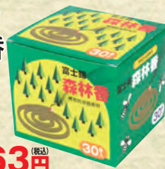
NEW パワー森林香 +携帯防虫器セット