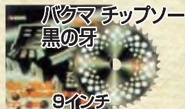
バクマ チップソー 黒の牙

9インチ (230mm×30P) 標準価格2,322円を 1,520円 (税込) 10インチ (255mm×30P) 標準価格2,430円を 1,620円 (税込)