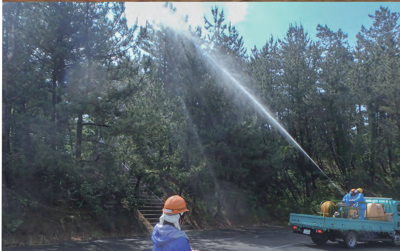
6月10日に松波・荒浜地内で実施した松くい虫防除作業(地上薬剤散布)